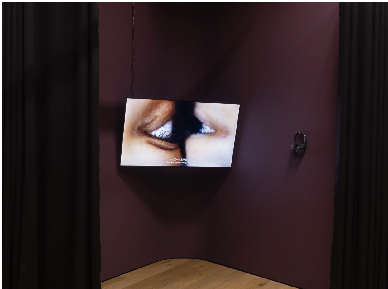
余沅榆、邓伯轩《目黑》 2023年，单频彩色录像装置、双语叙述、立体声音，11分8秒