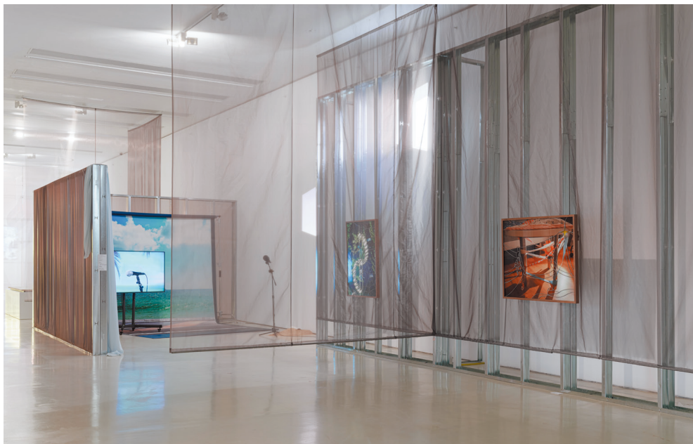
“跟着感觉走”展览现场