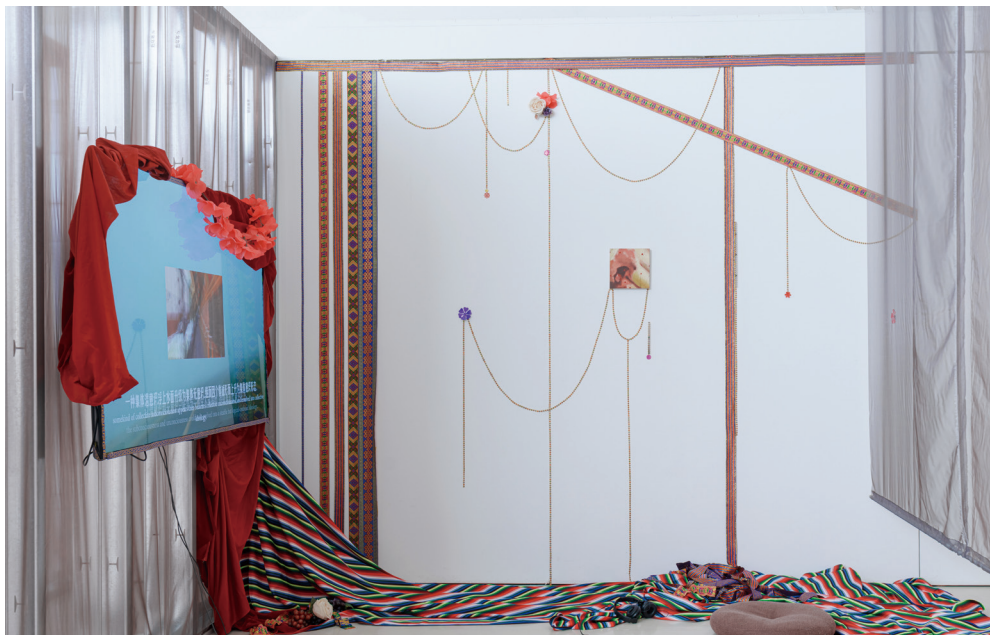
郭锦泓《向著内心最昏暗的方向》 2019 年，单频影像，15 分 21 秒